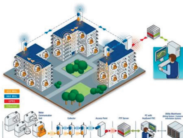
Рисунок 2.1 - Схема работы радиомодуля.

Радиомодуль может быть использован для работы в системах автоматического контроля, регулирования и управления технологическими процессами в системах газораспределения, теплоэнергетике, системах вентиляции и других отраслях.